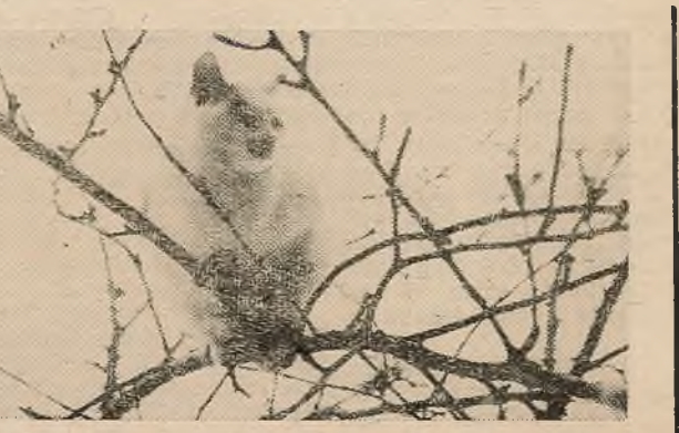
Пад вясновым сонцам.

Яшчэ некалькі запаведзей, пра якія неабходна памятаць пастаянна. Няветліва, а таму і непрыгожа: паказваць пальцам, асабліва на чалавека; разразаць старонкі часопіса ці кнігі грабянцом; выкарыстоўваць ногаць мізінца ў якасці зубачыткі, чысціць чаравікі аб калашыны штаноў, часта пазіраць на гадзіннік пры размовах з гасцем, жанчынай; ляпаць дзвярыма. Дзверы заўсёды трэба зачыняць «мякка», нават калі мы вельмі спяшаемся. Усе роўна, якія гэта дзверы: на працы, дома, у магазіне, у машыне. У спрэчках ляпанне дзвярамі не аргумент, а непрыстойны агрэсіўны выпад.